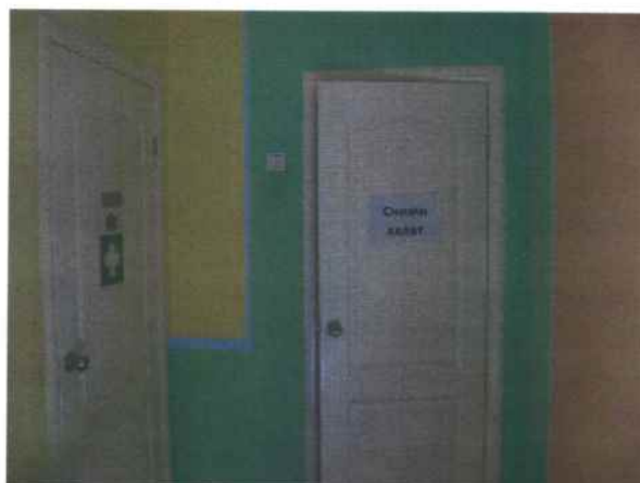
12. Медицинский блок, туалетная комната