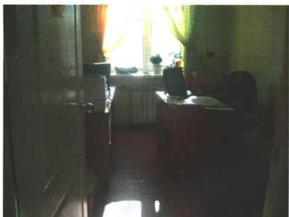
15. Кабинет приема МГН