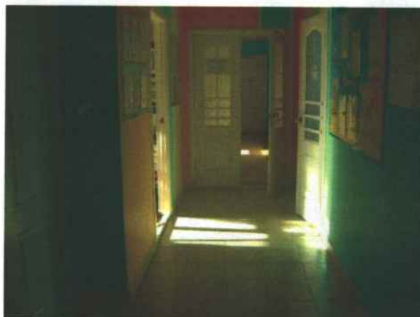
10. Коридор здания