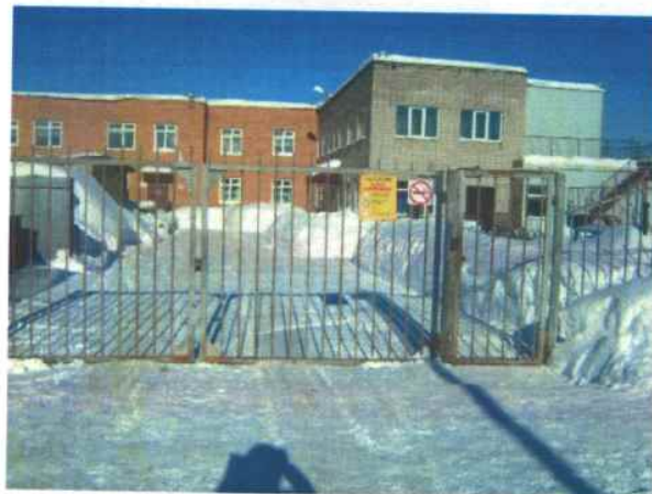
2. Входные ворота на территорию МБДОУ «Детский сад № 5»