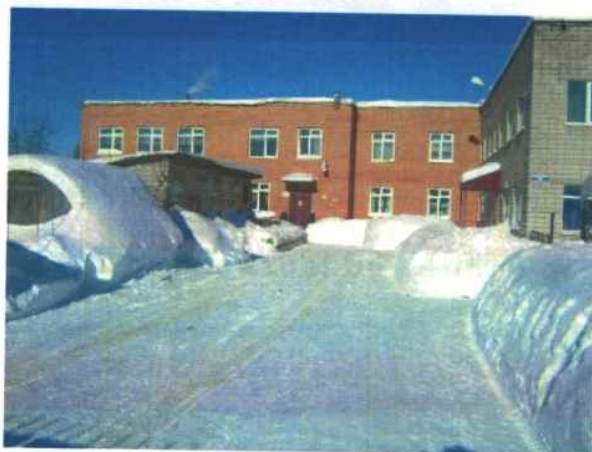
4. Территория, прилегающая к зданию МБДОУ «Детский сад № 5»