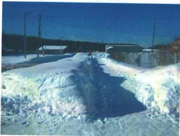
1. Путь от остановочного комплекса до МБДОУ «Детский сад № 5»