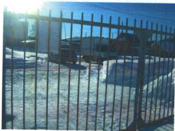
3. Автостоянка возле МБДОУ «Детский сад № 5»