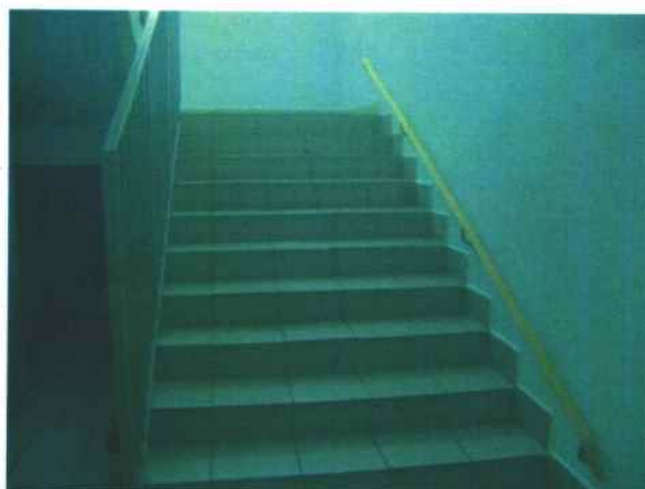
14. Лестница на второй этаж