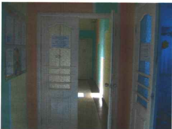
11. Коридор к кабинету медицинскому и туалетной комнате